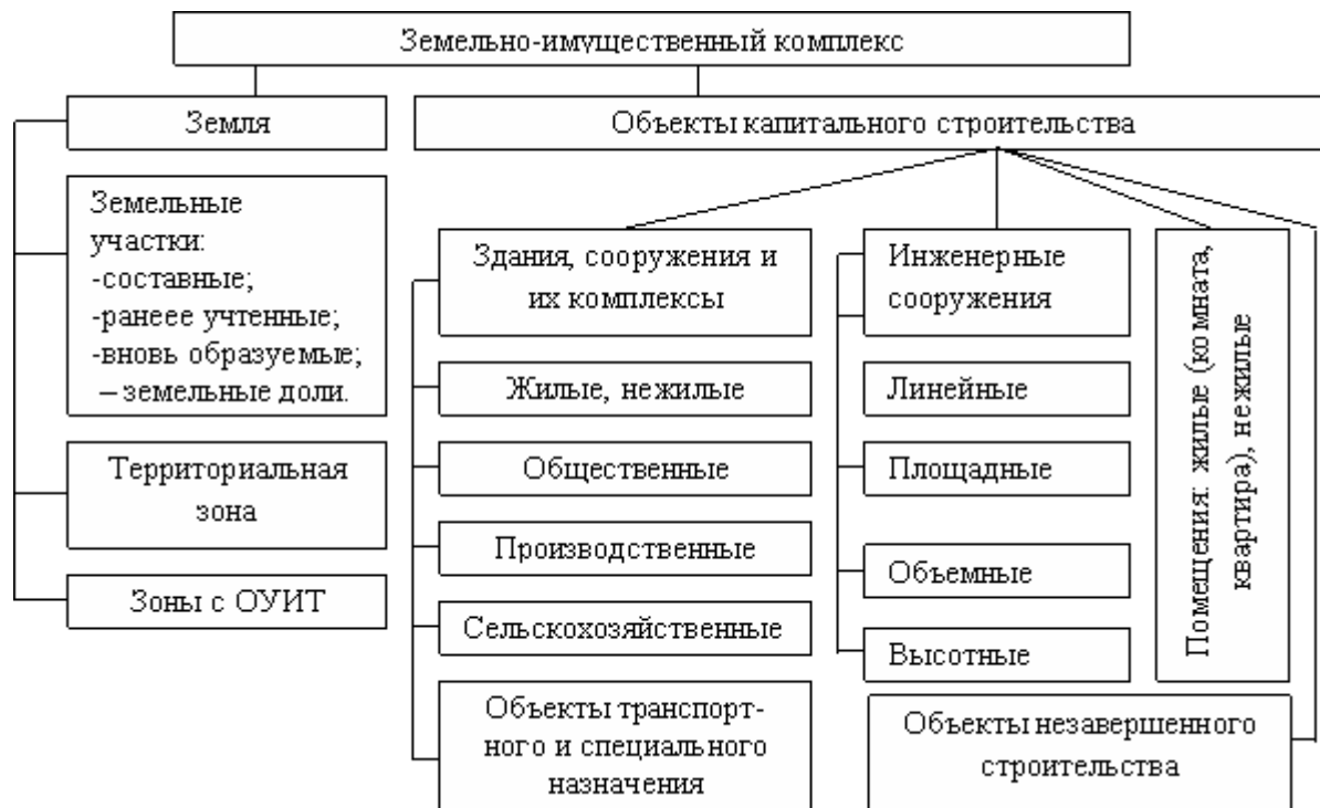
Рисунок 3. Классификация элементов ЗИК по виду и назначению

Классифицировать ЗИК можно по принципу, представленному в табл. 2 [9].