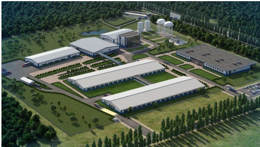
Рисунок 2. Пример ЗИК

Следовательно, принимая во внимание все вышеуказанное, под ЗИК понимается комплекс взаимосвязанных элементов и отношений между ними, который образован в соответствующих пространственно-временных условиях, в основе которого лежит ЗУ со всеми экономическими и юридическими привязанными к нему улучшениями, существующий под непосредственным руководством людей с целью удовлетворения различных потребностей: жизненные, производственные, развитие занимаемой территории (рис.2).