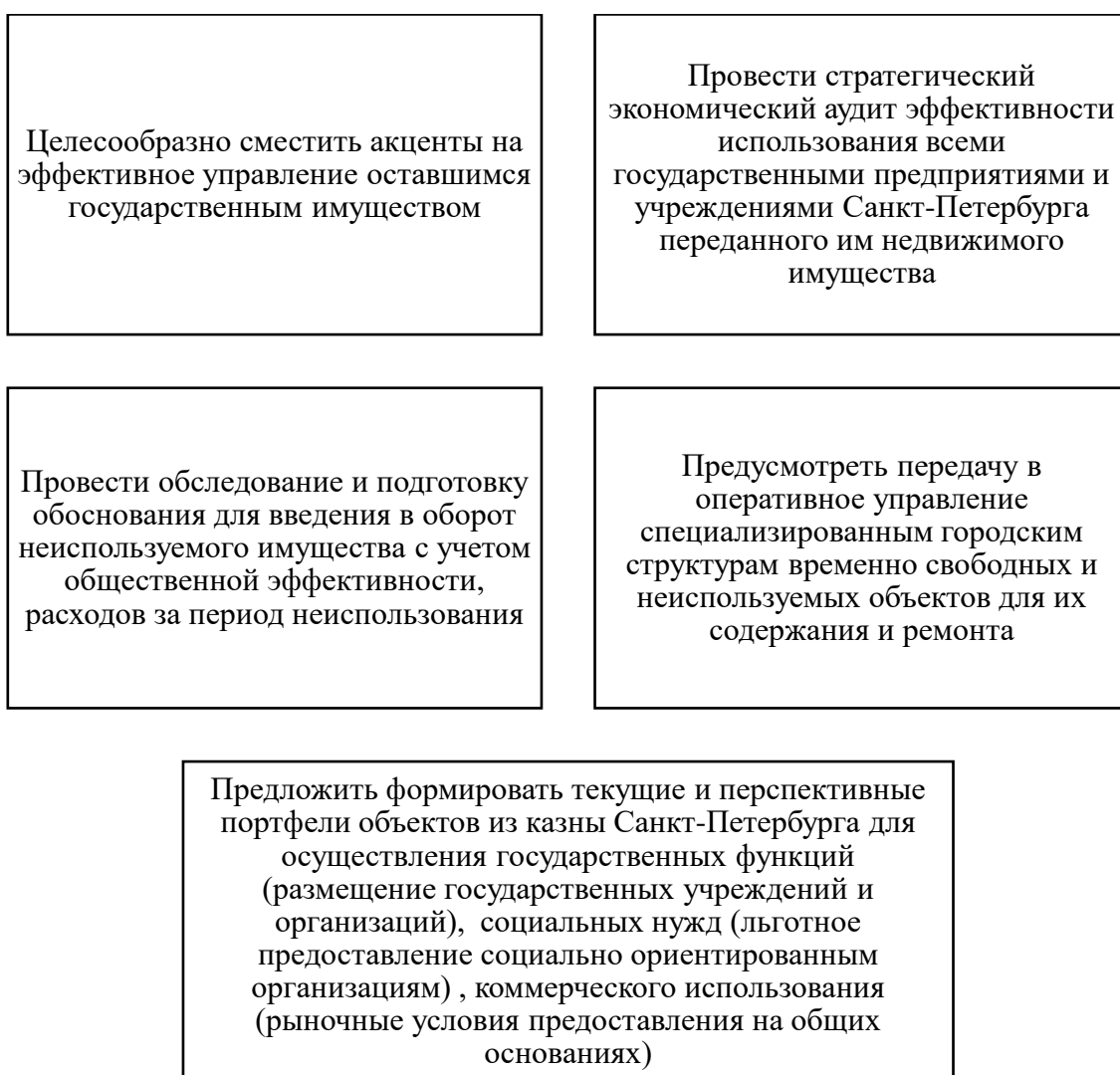
Рисунок 5. Комплекс мер по актуализации концепций земельного управления в г. Санкт-Петербург

Полноценное организационно-экономическое обеспечение развития производственных зон предполагает создание и сопровождение на городском уровне системы экономических программ по использованию территорий, производственному развитию и инвестиционной деятельности в их пределах.