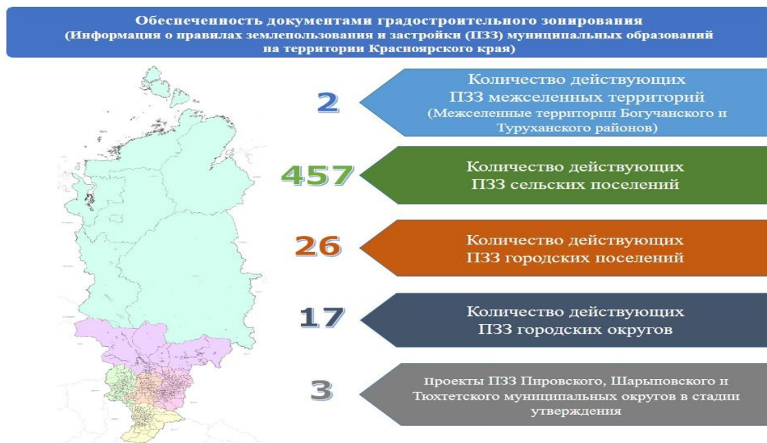
Рисунок 3 - Информация о правилах землепользования и застройки муниципальных образований на территории Красноярского края

На рисунке 3 показана обеспеченность документами градостроительного зонирования муниципальных образования Красноярского края. Наиболее полная информация о правилах землепользования и застройки представлена для сельских поселений.