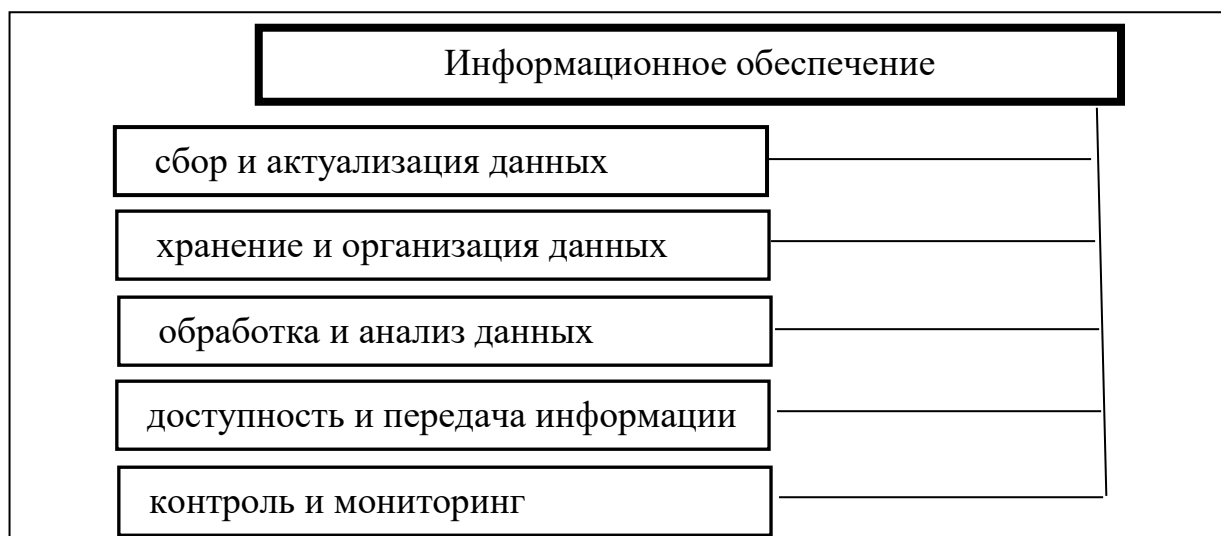
Рисунок 2 – Составляющие информационного обеспечения

Основные элементы, являющиеся составляющими информационного обеспечения представлены на рисунке 2.