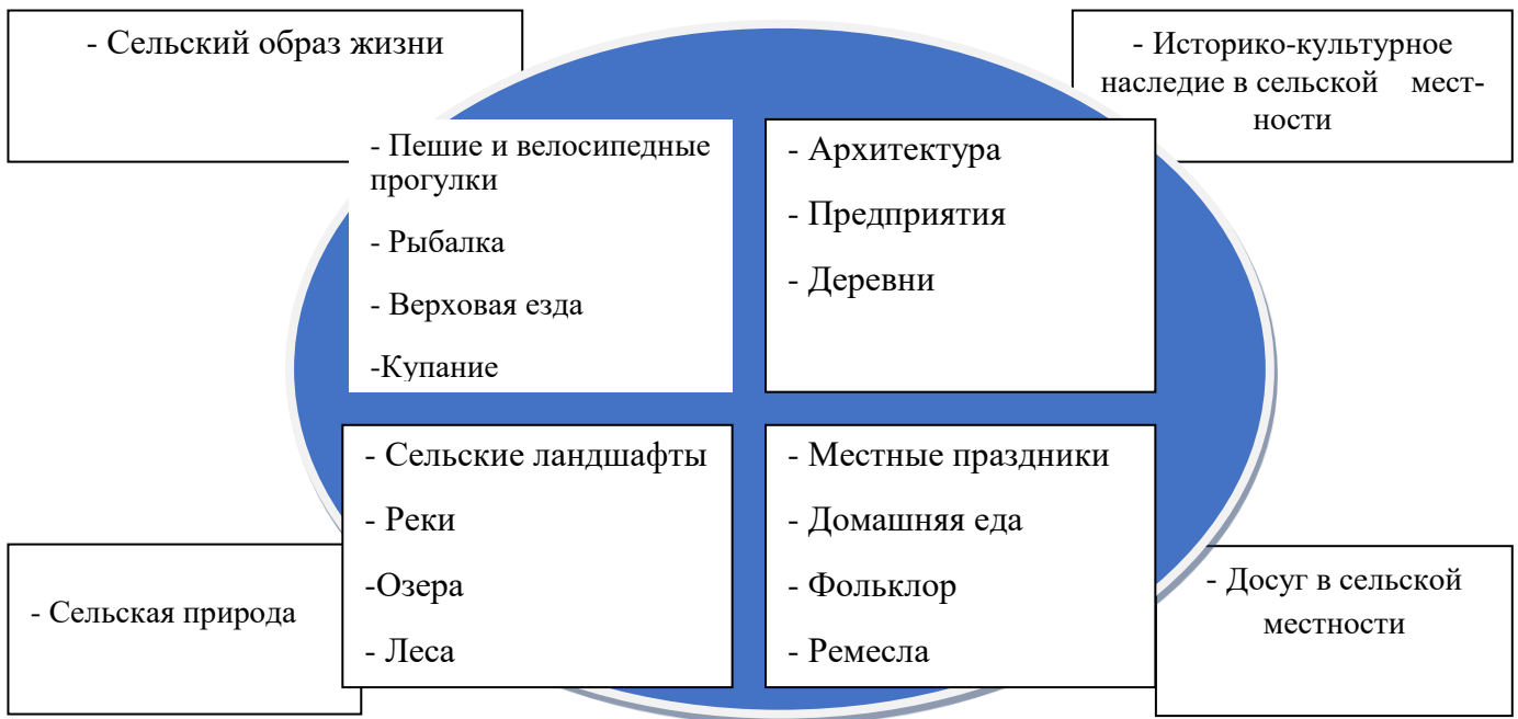
Рисунок 1. Виды сельского туризма

Популярное направление отдыха хорошо известно в мире. В разных странах путешественники с удовольствием ездят в сельскую местность и малые города, численностью до 30 тысяч жителей. Особенно развит сельский туризм во Франции, Италии и Испании. Человек, уставший от шума и городской суеты, может хорошо отдохнуть на природе и познакомиться с традиционным укладом местных жителей. На селе туристы с удовольствием узнают о тонкостях выращивания разных культур и участвуют в сельскохозяйственных работах. Виды сельского туризма (Рис.1):