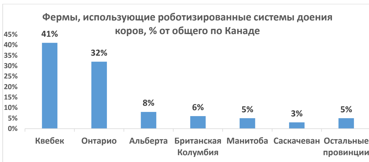
Рисунок 2. Использование роботизированных систем доения на фермах Канады

Внедрение и адаптация новых производственных технологий и методов стали факторами модернизации сельского хозяйства в Квебеке. Квебек является лидером в Канаде по применению роботизированных технологий доения. На провинцию приходится 41% от общего числа молочных ферм в Канаде, использующих эту технологию (рис. 2).