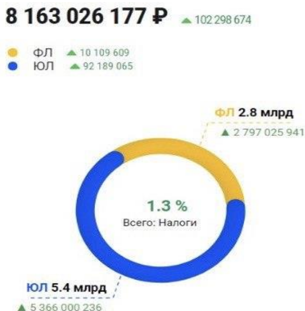
Рисунок 3. Показатель налога за июнь 2024 года

Рассмотрим показатели налога за июнь 2024 г. и за май 2024 г. на рисунке 3 и 4.