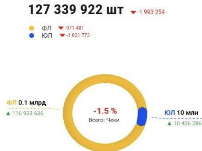
Рисунок 5. Показатель квитанции за июнь 2024 года

Рассмотрим показатели квитанции за июнь 2024 г. и за май 2024 г. на рисунке 5 и 6.