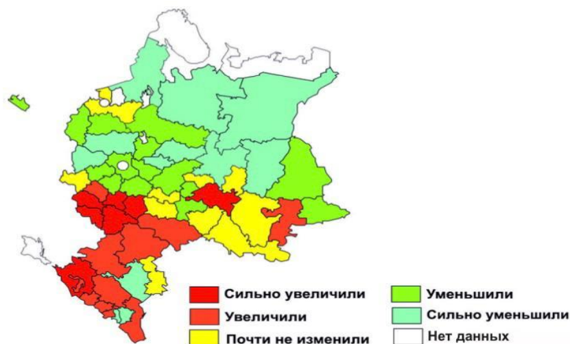
Рисунок 7. Доля сельскохозяйственного производства Европейской части России

В южных регионах Европейской части России благоприятное сочетание всех факторов способствовало "сдвигу" производства в эти районы. На рисунке 7 предоставлен объем сельскохозяйственного производства Европейской части России