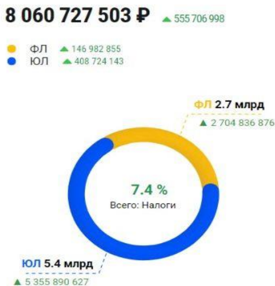
Рисунок 4. Показатель налога за май 2024 года

Рассмотрим изменение показателей налога за предыдущий календарный месяц