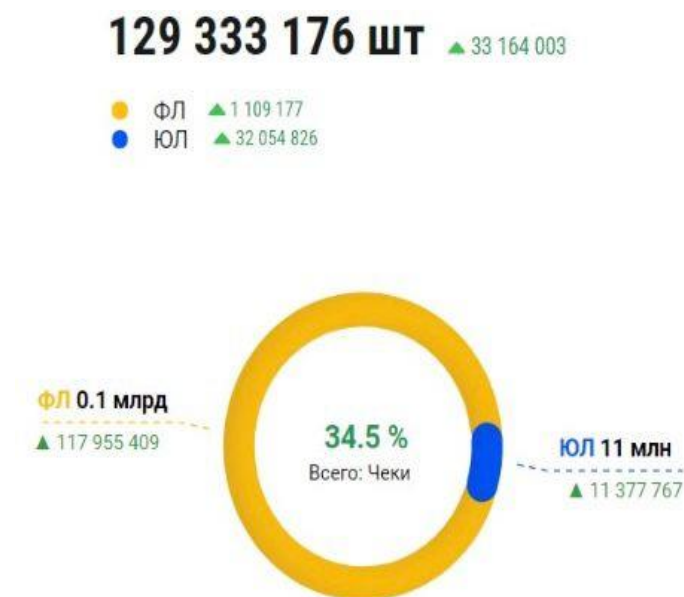
Рисунок 6. Показатель квитанции за май 2024 года

Рассмотрим изменение показателей квитанции за предыдущей календарный месяц