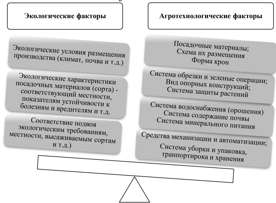
Рис.5. Основные факторы, влияющие на эффективность садоводства в современных условиях

Как справедливо отмечает Валерий Фальков: «наука – это база климатической повестки. ... что необходимость формирования собственной методики отслеживания углеродного следа и последующие процессы декарбонизации повлияют не только на экономику страны, но и на систему российского высшего образования. Необходимо качественное изменение профессий и системы подготовки новых кадров, которые придут работать в совершенно новые направления. Развитие декарбонизации на территории России невозможно без участия науки и трансформации высшего образования» [3].