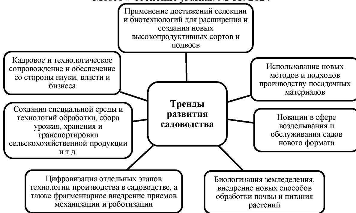
Рис. 4. Тренды развития садоводства России в новых реалиях

Приведённый на рис.4 перечень трендов развития садоводства России является обобщенным, но характеризующим стратегические и основные направления трансформации отрасли в условиях цифровизации и реализации концепции устойчивого развития сельского хозяйства. По мнению В. И. Трухачев «для полноценного перехода отечественного промышленного садоводства от традиционных к интенсивным технологиям необходим комплексный подход, применение которого может в достаточной степени нивелировать основные факторы, сдерживающие его развитие, в частности это касается существующего дефицита отечественного посадочного материала для массового перехода на интенсивные технологии, дефицита отечественных средств комплексной механизации, имеющих принципиальные отличия при применении интенсивных технологий, дефицит высококвалифицированных кадров» [19, с.44].