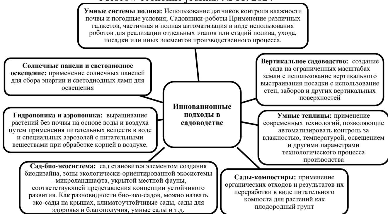
Рис. 2. Систематизация инновационных подходов в садоводстве России

Преимущественно инновационные подходы в садоводстве приведенные на рис.2., ориентированы на обобщение и разработку способов и приемов снижения негативного влияния на окружающую среду, учет влияния природно-климатических факторов, максимальное снижение зависимости от них. Современные технологии направлены на расширение возможностей для создания экологически-чистых, универсальных, комфортных садов, позволяющих формировать особую среду и экосистему для отдыха; выращивания растений и продуктов питания ориентированный на здоровье населения. Существенная зависимость от изменений климата и природно-климатических факторов, определяет основной вектор трендов трансформации садоводства в современных реалиях. С помощью современных технологий и инновационных подходов создаются уникальные и максимально-приближенные к природным условиям экосистемы для закладки садов; внедряются инновации, позволяющие минимизировать зависимость от климатических факторов. Современные сады более климатоустойчивые к экстремальным погодным условиям, устойчивы к