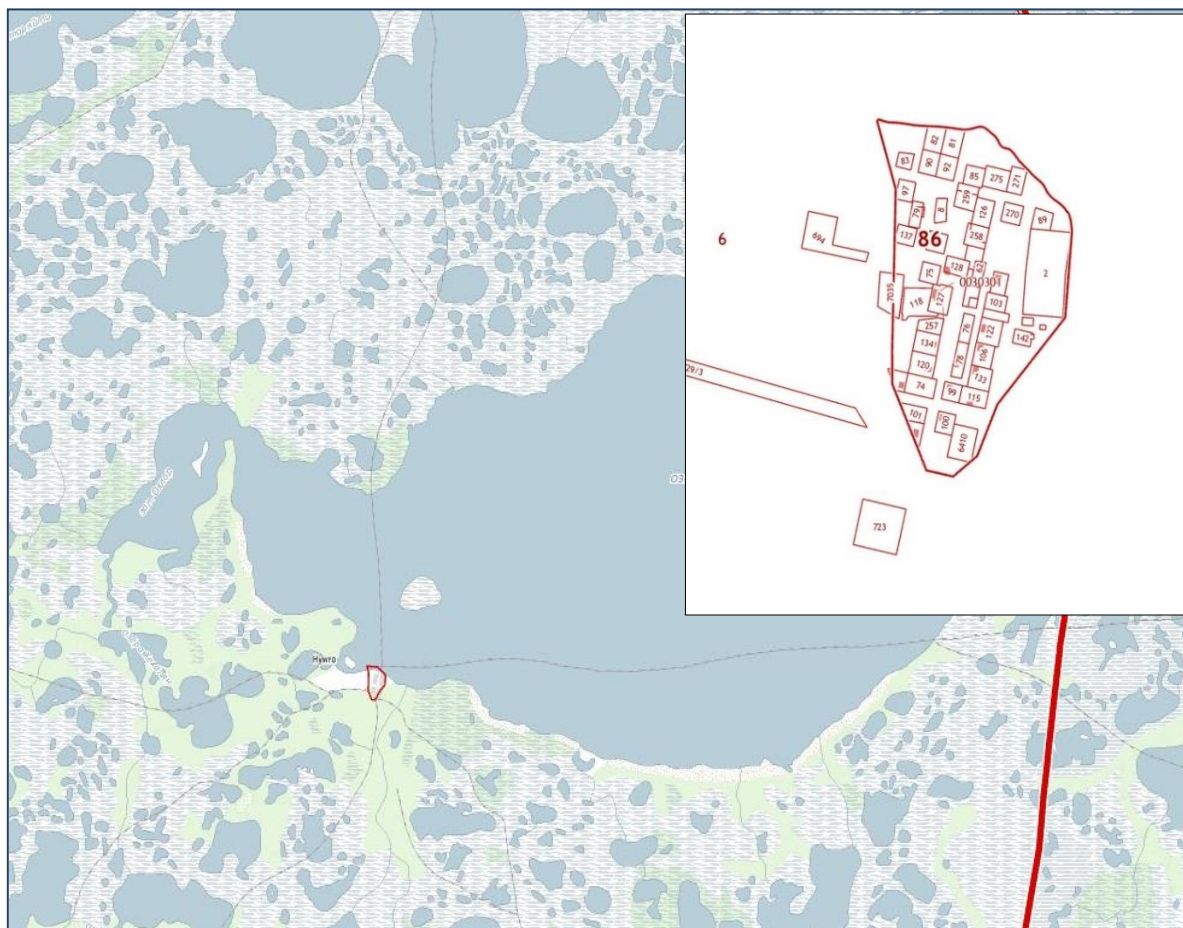
Рисунок 6. Границы кадастрового квартала 86:06:0030301 в пределах Достопримечательного места «Нумто» (авторские разработки)

Территория Достопримечательного места «Нумто» входит в кадастровый квартал 86:06:0030201. Однако в территорию Достопримечательного места «Нумто» входит другой кадастровый квартал (в котором располагается деревня Нумто в зоне с учетным номером 86:06-8.107) с номером 86:06:0030301.