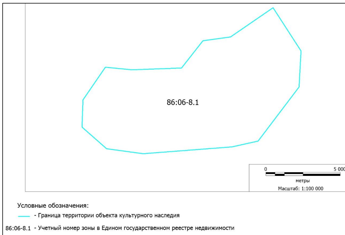
Рисунок 3. Схема границ зоны объекта культурного наследия Достопримечательное место «Нумто» (авторские разработки)