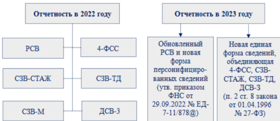
Рисунок 1. Сравнение форм отчетности до и после 2023 года

На первый взгляд, число отчетов с 2023 года должно было уменьшиться в два раза, но это иллюзия. К примеру, у единой формы сведений, объединяющей с 2023 года 4-ФСС и ряд персональных отчетов, нет общей отчетной даты — предполагается, что отдельные разделы нужно будет представлять в разные сроки. По сути, отчеты, представляемые до 2023 года, объединили под один титульный лист и сделали разными разделами со своими сроками и порядком сдачи.