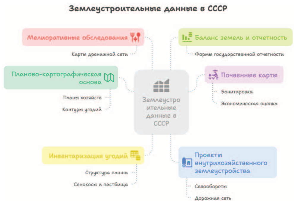
Рисунок 1. Землеустроительная документация, которая готовилась в Советском Союзе на всех землях Figure 1. Land management documentation prepared in the Soviet Union for all lands

Преобладающая часть полномочий по измерительно-кадастровой части землеустройства в настоящее время сосредоточена у Росреестра, который курирует регистрацию, кадастр, учет, надзор и обеспечивает инфраструктуру пространственных данных страны, а также контролирует саморегулирование профессионального сообщества кадастровых инженеров и оценщиков. Получив эти функции Росреестр стал ярким противником возрождения института землеустройства, как единого проводника земельной политики государства, считая его «рудиментом плановой экономики» [4].