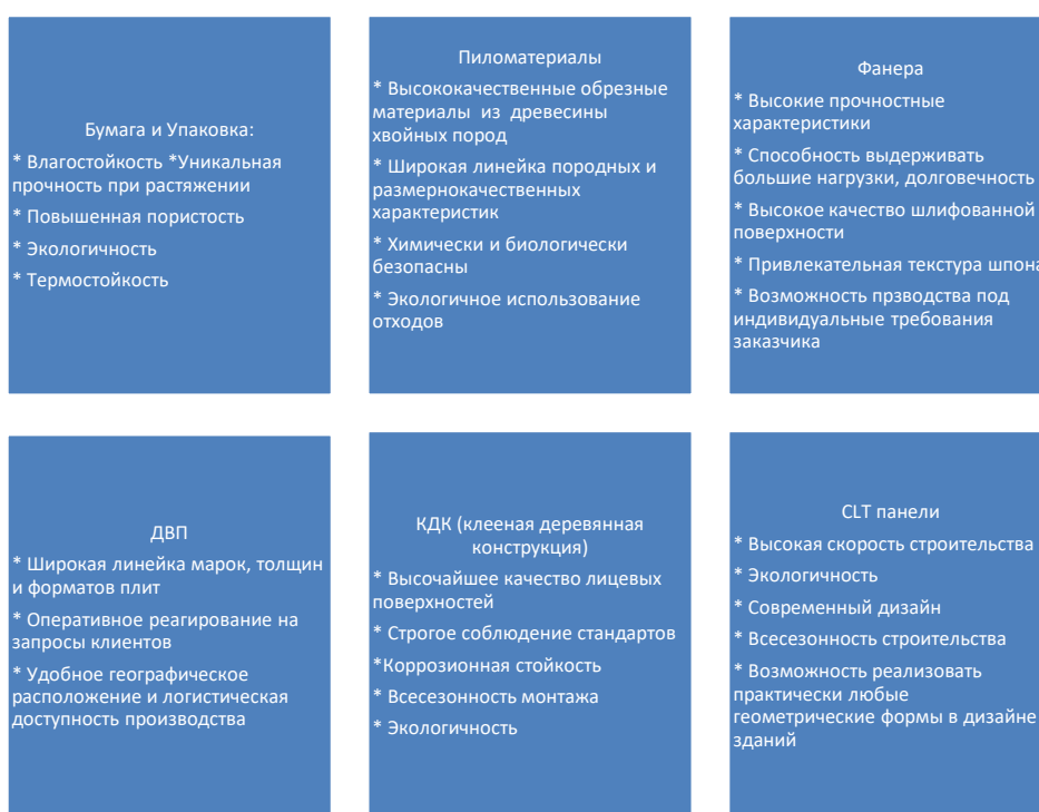
Рисунок 5. Конкурентные преимущества продукции

Одним из наиболее важных конкурентных преимуществ любой лесопромышленной компании как на внутреннем рынке, так и на международном является лесобеспечение. Компания Сегежа Групп обеспечивает себя лесом на 93%. Это дает возможность компании продуктивно осуществлять контроль затрат. Существенная сырьевая база дает компании конкурентоспособное преимущество более успешного контроля над себестоимостью продукта. Бизнес модель также является одним из конкурентных преимуществ. Для производства широкого продуктового/ассортиментного портфеля компании при вертикальной интеграции характерно наличие большого количества переделов, что в свою очередь приводит к увеличению добавленной стоимости конечного продукта. Использование же горизонтальной интеграции позволяет максимально эффективно избежать потерь благодаря применению основной части дерева для производства целлюлозы, и как следствие бумаги, нижнюю часть — для изготовления пиломатериалов, а отходы производства в виде опилок и щепы используются в качестве основного сырья для производства топливных брикетов и пеллет. (Рисунок 5)