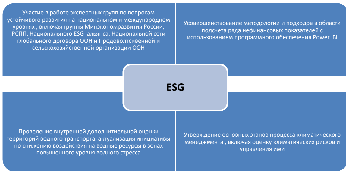
Рисунок 4. Ключевые успехи в области ESG

Исходя из вышеописанного, можно сделать вывод, что деятельность компании Сегежа Групп в области устойчивого развития имеет системный подход и направлена на достижение результативности и эффективности.. В компании действует Стратегия в области устойчивого развития, в рамках которой выделены четыре существенные направления.