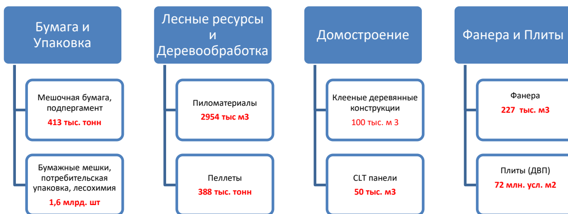
Рисунок 1. Производственные мощности в 2022г

Рассмотрим производственные мощности, долю в выручке основных направлений бизнеса, а также ключевые финансовые показатели (Рисунок 1,2), (Таблица 1).